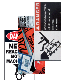
Maquinaria e Instalaciones

Las nuevas tintas y cabezales de avanzada tecnología, permiten a la nueva VP495 conseguir gráficos de alta calidad , códigos de barras y textos bien definidos gracias a su alta resolución de 1200x1200 dpi – resolución desconocida para cualquier otra impresora en el mercado hasta la fecha, basada en tintas de pigmento.